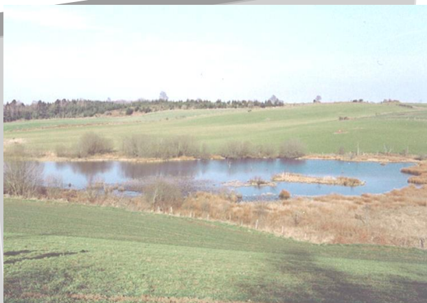
Schéma Départemental de Gestion Cynégétique